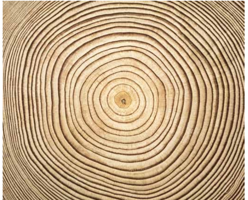
Holz ist der wichtigste nachwachsende Rohstoff und der Hauptbestandteil der StoTherm Wood-Dämmplatten.

StoTherm Wood eignet sich für Neubauten wie Sanierungen gleichermaßen. Das besonders für das nachhaltige Bauen geeignete System verbindet gute Wärmedämmeigenschaften mit einem leistungsfähigen sommerlichen Wärmeschutz und gutem Schallschutz. Es ermöglicht