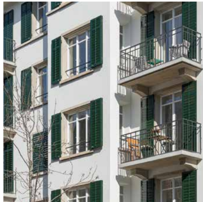
Bei der Sanierung eines Mehrfamilienhauses im Zürcher Seefeldquartier setzte der Bauherr auf eine Innendämmung mit Sto-Innendämmplatten und konnte so die historische Fassade erhalten.