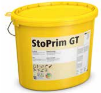
Praktisch und verarbeitungsfertig: StoPrim GT

Sauberer, sicherer, vielseitiger und schneller als alle anderen Grundierungen auf dem Markt – StoPrim GT ermöglicht effizienteres und einfacheres Arbeiten. Eine echte Innovation der Sto AG.