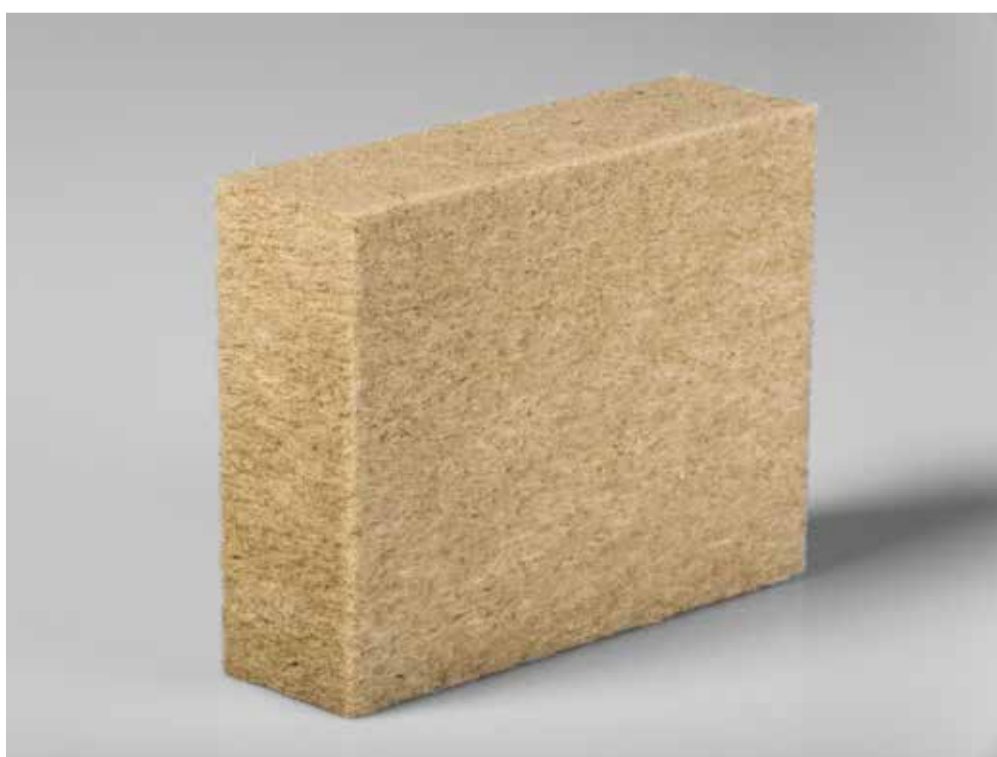
Die Holzweichfaser-Dämmplatte für Massivbauten: nachhaltig, effizient und ergebnissicher.