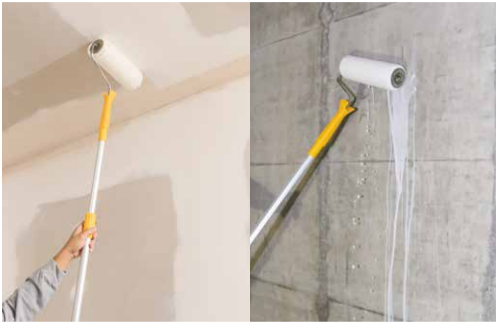
Schluss mit Spritzern. Mit StoPrim GT macht Grundieren Spass

Grundierungen für Decken und Wände sind üblicherweise dünn wie Wasser und spritzen dementsprechend bei der Applikation. Das ist sehr mühsam und senkt die Arbeitsmoral innert kürzester Zeit. Zum Glück ist damit nun Schluss. Die neue Grundierung StoPrim GT mit Gel-Technologie ermöglicht tropffreies Arbeiten auf mineralischen und organischen Untergründen. Eine Allrounderin, mit der Grundieren endlich wieder Spass macht.